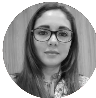
Isabel Giménez Amandau Fabricación de Helados Importadora /Exportadora